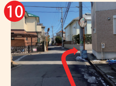
10 さらに直進20m次の交差点を 右へ50m道なりに