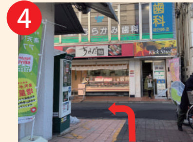
4 西友の前を通り、すぐに左折