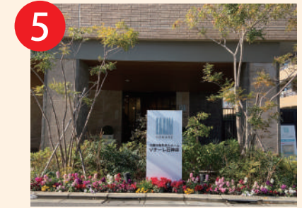
5 左手に見えるのが「ソナーレ石神井」です