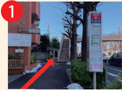
1 「善福寺」バス停を青梅街道方面へ直進