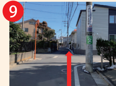
9 テニスコートを右手に 直進20mの三叉路は直進