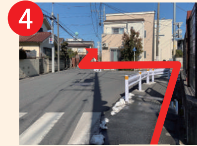
4 突き当り三叉路を歩道に沿って横断歩道を渡り直進50m