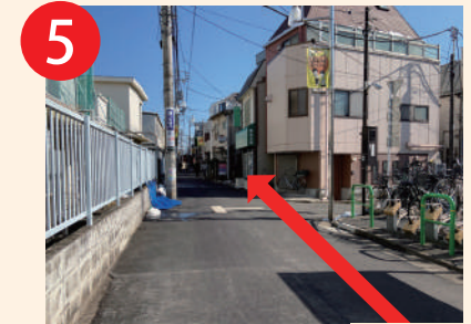
5 直進100mにある1つ目の 三叉路は直進