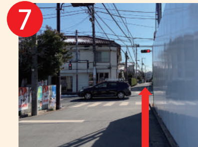
7 直進100m、「千川通り」信号を 直進