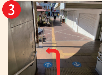
3 階段を下りて、すぐに左折