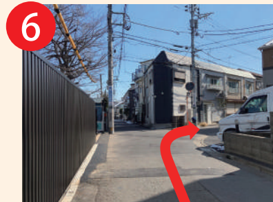
6 さらに直進100m三叉路を右へ