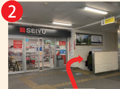
2 西友手前 右の階段を下る ※階段手前、右手にエレベーターも ございます