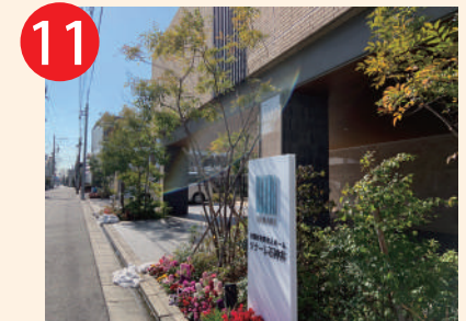
11 右手に見えるのが 「ソナーレ石神井」です