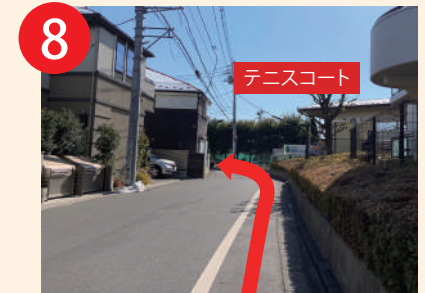
8 信号を渡り直進200m、 テニスコートが見えてきます。 道なりに左方面へ。