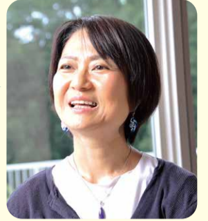
ご家族(ご入居者Y様の三女様)インタビュー

毎日の食事を美味しくいただけることが一番。穏やかに優しいスタッフの皆さんのおかげでおもしろおかしく過ごしています。