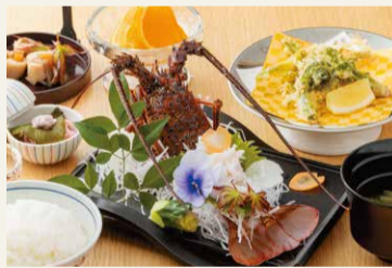
産地ブランド食材を使った昼食例(伊勢志摩産・伊勢海老)

健康的な栄養バランスやアレルギーなど、身体の状態を考慮して栄養士が献立を準備し、ホーム内の厨房で調理した温かい食事をお楽しみいただけます。また、産地から直接仕入れた「産地ブランド食材」を用いた食事でも週に1回、お出しします。