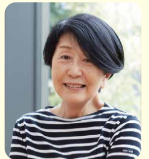
ご家族(ご入居者S様のご長女様)インタビュー

どんなことも、ビジネス的ではなく、まるで家族のように耳を傾けてくださるので、要望が言いやすく、すぐに対応していただけます。いつか必要なときがきたら、私自身が入居したいと、心から思えるようなホームです。