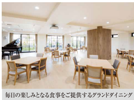
毎日の楽しみとなる食事をご提供するグランドダイニング