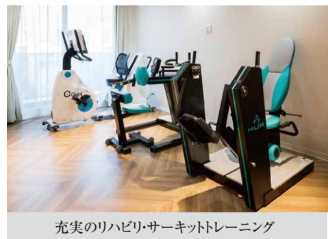
充実のリハビリ・サーキットトレーニング