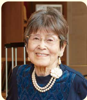
ご入居者(K様)インタビュー

認知症の母を6年半1人で介護。お互いに大変な思いもしてきましたが、今は24時間看護師さんがいる環境で、母も私も安心して過ごせることに感謝。