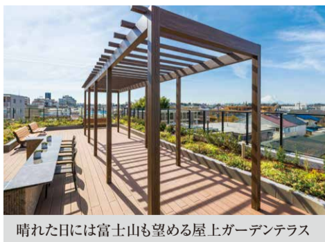
晴れた日には富士山も望める屋上ガーデンテラス