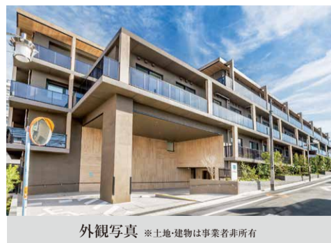
外観写真 ※土地・建物は事業者非所有

看護職員を24時間配置し、見守り体制を強化しています。大切なご家族が安心してお過ごしいただけるホームです。